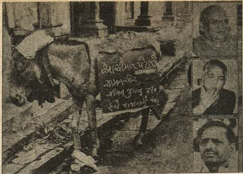
1972 குஜராத் மாணவர்களின் ஊழல் ஒழிப்பு - நவநிரமான் போராட்டம் "சிமன் பாய் திருடன், பதவி விலகு" என எழுதி, கதர் குல்லாய் போட்டுள்ள கழுதை. மேலிருந்து கீழ் சிமன்பாய் பட்டேல், வல்லு பிரசாத் யாதவ், முலாயம் சிங் யாதவ். - தேவிலாவின் அரசியல் அடியாட்கள்.

ஆனால், தேவிலால் இதற்கு முன்னரே கட்சியில் தனது அதிகார செல்வாக்கை பயன்படுத்தி, கட்சி, ஆட்சியின் அதியுயர் அதிகார அமைப்பான 'பார்லிமெண்ட் அர