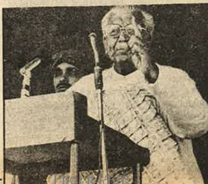
100 நோட்டு தீதாம்பரத்துடன் தேவிலால்