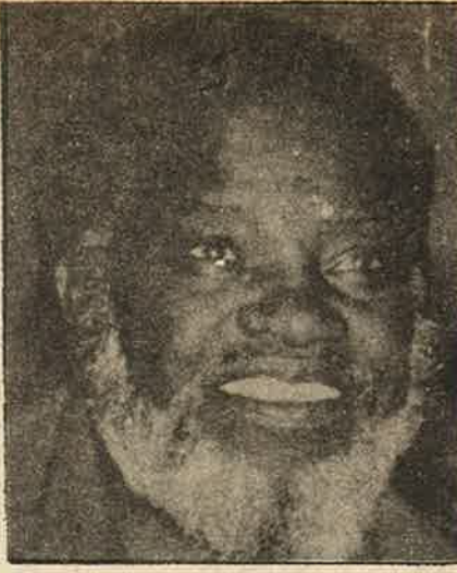
நமீபியாவின் புதிய அதிபர் நிஜோமா.

ஆனால் ஐ.நா. பாதுகாப்புப் படையையே தென்னாப்பிரிக்க காட்டுயிராண்டிகள் தாக்கினர். ஐ.நா. படை என்ற பெயரில் ஏகாதிபத்திய உளவாளிகள் ஊடுருவி ரகசியமாக ஸ்வாபோவிடந் செயல்வீரர்களையும் போராளிகளையும் கொன்றொழித்தனர். எப்படியாவது அரசியல் நிர்ணய