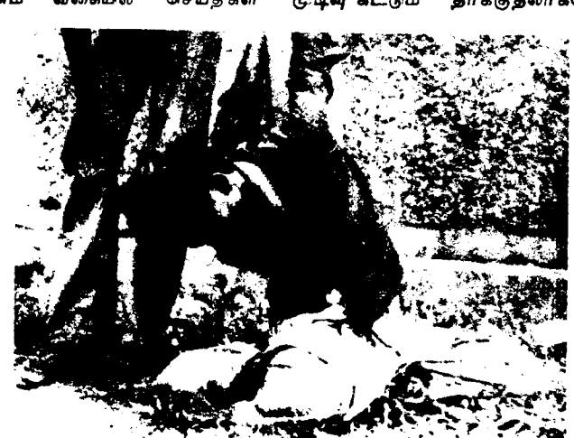
காட்டிக் கொடுக்கும் இனத் துரோகிக்கு போராளிகள் நிறைவேற்றிய மரண தன்டனே...

இருந்து முல்லேத்தீவில் 104 இன்ஞர்களே ஈரப் பெரிய குளம் என்ற ராணுவ முகாமுக்கு கொண்டு சென்முர்கள் அங்கு சுட்டு கொன்ற<u>ு</u> அவர்களே இருக்கிறுர்கள் : வவுனியாவில் இருந்து 57 பேரை ் பிடித்துச்