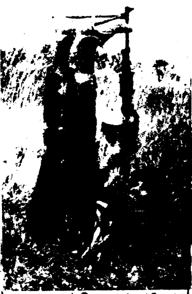
துப்பாக்கியால் சிங்கள வெறலிகாப்டரை வைக்கும் விடுதலே விரர்.

ு ஏறத்தா ழ தமிழினமே பூண்டற்று போய் விடக்கூடு ம் என்றை அச்சம் ஏற்பட்டுள்ளது: நீங்கள் ஒன்று பட்டு தாக்கு தலே தொடங்குவ த ற்குள் இள்ளுர் களே இருக்க மாட்டார்கள் என்ற வந்து விடுமோ என்<u>ற</u> வகையி ல் செய்திகள் அஞ்சும்