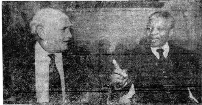
ஜனாதிபதி டி. கிளார்க்குடன் நெல்சன் மண்டேலா

இதுவரைகாலமும் இருந்துவந்த அணுகுமுறையான, தனது வழிக்கு வர மறுக்கும் உலக அரசுகளைத் தண்டித்து தனதுபக்கம் இழுக்கும் அணுகுமுறைகளை மாற்றி, இப்போது உதவிகள் புரிவதன்மூலம் அவ் அரசுகளைத் தனது கைக்குள் வைத்திருக்க முயல்கின்றது. அந்