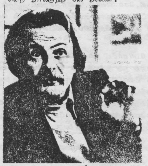
இவர் கேறகிறுர் 1917இல்

அ6்ததாக நெறிவடைப்பே யின் "புரட்சியில் பூரட்சூ" என்ற நாலிருந்தே சிலை தளிகள்.