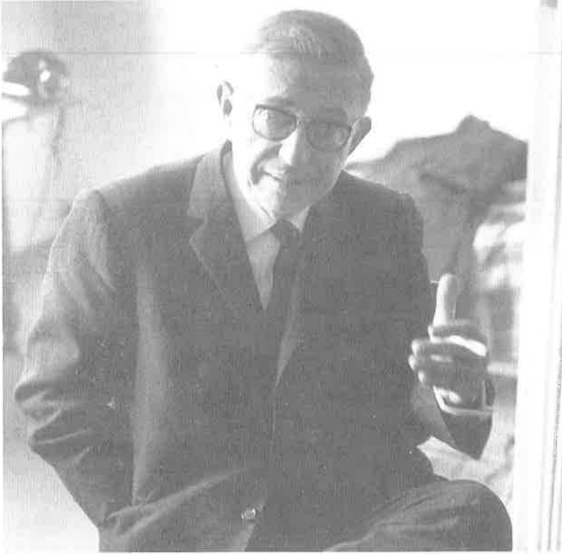
ஜோன் போல் சாத்தர்

புலனானுபவத்தை கூர்மையாக விசாரணை செய்கிறது. புலன்களின் வெளிச்சத்தில் புலனாகும் இந்த உலகத்தின் தோற்றப்பாட்டை மிகவும் நுண்ணியமாக ஆராய விழைகிறது. பட்டுணர்வின் பண்புகளை விளக்க முனைகிறது.