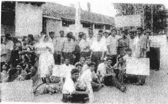
07.04.00 மக்கள் போராட்டம்- மடம் உதயன்

மணிவண்ணன், தமிழர் கண்ணோட்டம் July/Aug. 1996