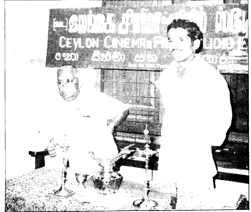
யாழ்ப்பாணத்தில் ஒரு தொழிற்சங்கக் கூட்டத்தில்

இதே காலத்தில் அமெரிக்காவில் வியட்நாம் யுத்தத்துக்கெதிரான மாபெரும் இயக்கமொன்று நடைபெற்றது. வியட்நாம்