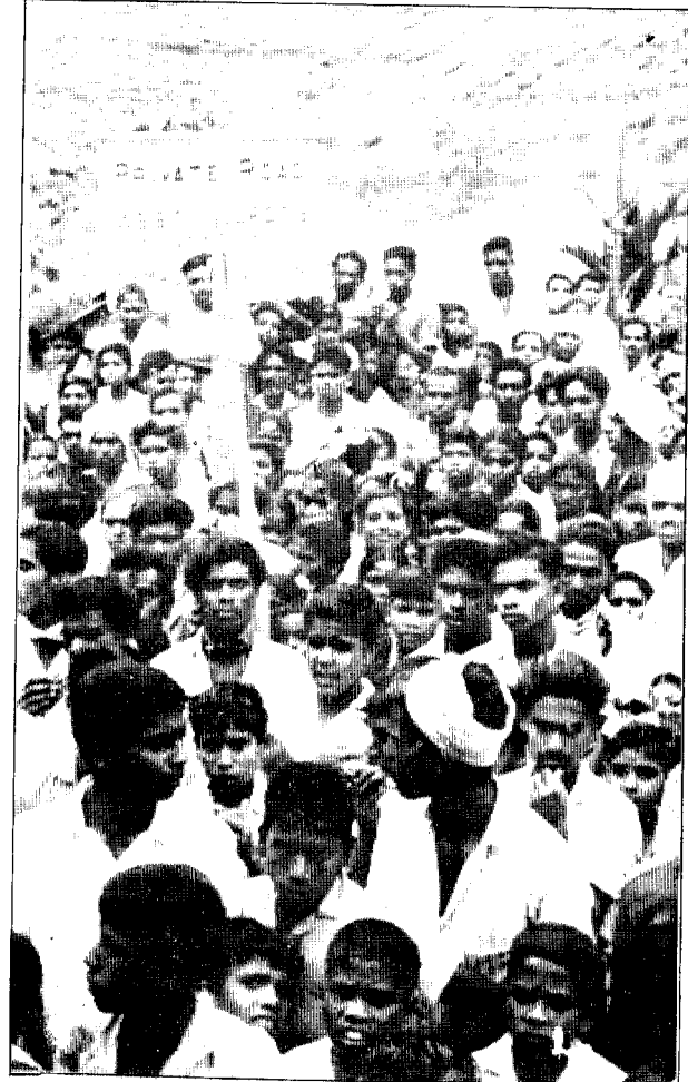
தோட்டத் தொழிலாளர்கள் பேரணி.

1971-ம் ஆண்டு மார்ச் 2-ம் திகதி நடந்த இக்கூட்டத்தை நான் ஒரு போதும் மறக்க மாட்டேன். ஹட்டன் செங்கோலம் பூண்டது. அது சகல சங்கங்களும் கலந்து கொண்ட கூட்டுக்