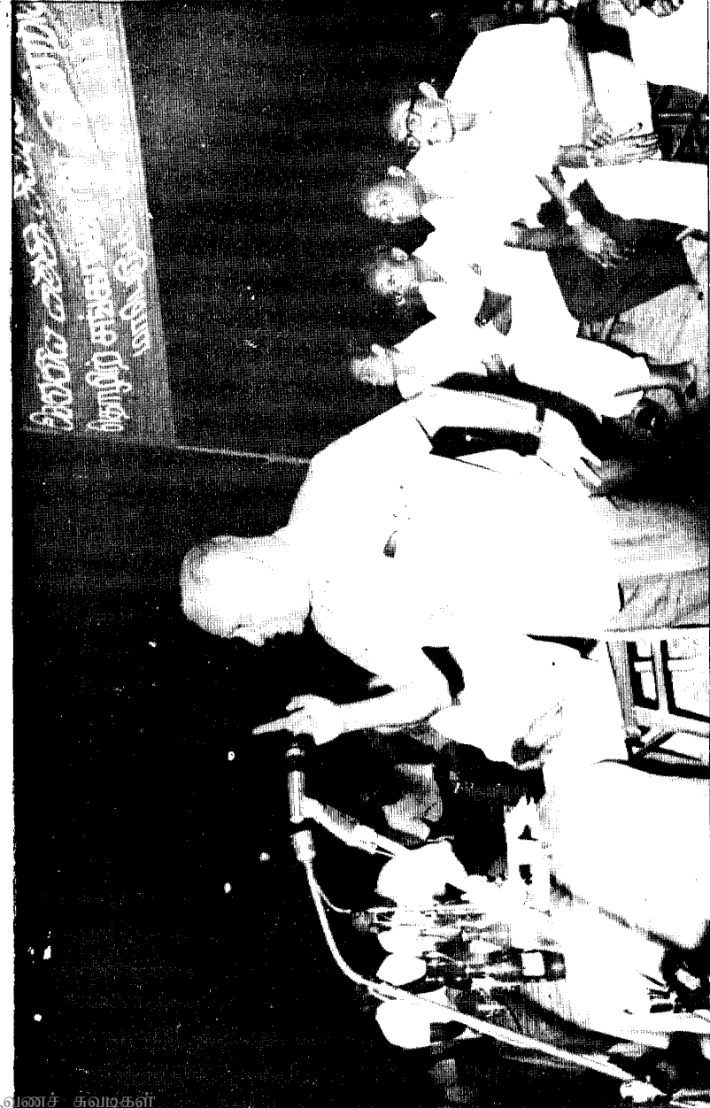
தொழிற்சங்கங்களின் கூட்டுப் பேரணியில் உரையாற்றும் போது... ஹைட் பார்க், கொழும்பு - 27.12.1977.

பொருளாதார நெருக்கடி மோசமடைய மோசமடைய வேலை நிறுத்தங்கள் அடிக்கடி ஏற்பட்டன. திரு பண்டார நாயக்காவின் ஆட்சியில் நடந்ததுபோல் அல்லாது, சிறீலங்கா சுதந்திரக் கட்சி அரசாங்கம் நிதி அமைச்சர் பிலிசஸ் டயஸ் பண்டாரநாயக்காவின் தூண்டுதலில் வேலை நிறுத்தங்களின் போது பேச்சு வார்த்தைகளை நடத்துவதில்லை என்ற கொள்கையைக் கடைப்பிடித்தது. இதனால் துறைமுக வேலைநிறுத்தம், வங்கி வேலைநிறுத்தம், வெள்ளவத்தை ஆலை வேலைநிறுத்தம் ஆகிய மிக நீண்டகால வேலை நிறுத்தங்கள் இடம் பெற்றன. வெள்ளவத்தை ஆலை நிறுத்தத்துக்கு சி.டி.யு.எப். தலைமை தாங்கியது. நாலு மாத காலம் இந்த வேலைநிறுத்தம் நடைபெற்றது. நான் இந்த வேலைநிறுத்தத்தில் பெரிதும் பங்கு பற்றினேன். பிணக்கு தொழில் கோர்ட்டுக்கு சமர்ப்பிக்கப்பட்ட பின் இந்த வேலை நிறுத்தம் கைவிடப்பட்டது. சங்கத்தின்