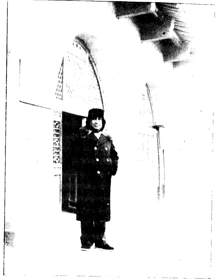
ஏனானில் உள்ள குகை முன்பாக. இங்குதான் மாவோ 13 ஆண்டு காலம் வாழ்ந்தார்.

சுயநலத்துக்கு எதிரான போராட்டத்துக்கும் திரிபுவாதத்துக்கு எதிரான போராட்டத்துக்கும் இடையில் உள்ள உறவையும் தோழர் மாசேதுங் புரிந்து கொண்டார். கூட்டுக்கு மேலாக தனி நபரின் நலனை முன் வைப்பது சுயநலனுக்கு முக்கியத்துவம் கொடுப்பது தனிப்பட்ட புகழ், பெருமையை நாடி ஒடுவதையும்