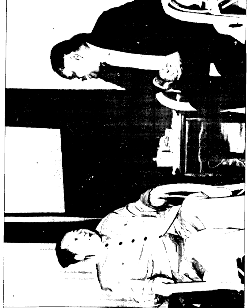
தலைவர் மா சே தூங் அவர்களுடன் ஜூன் 1967-ல்.