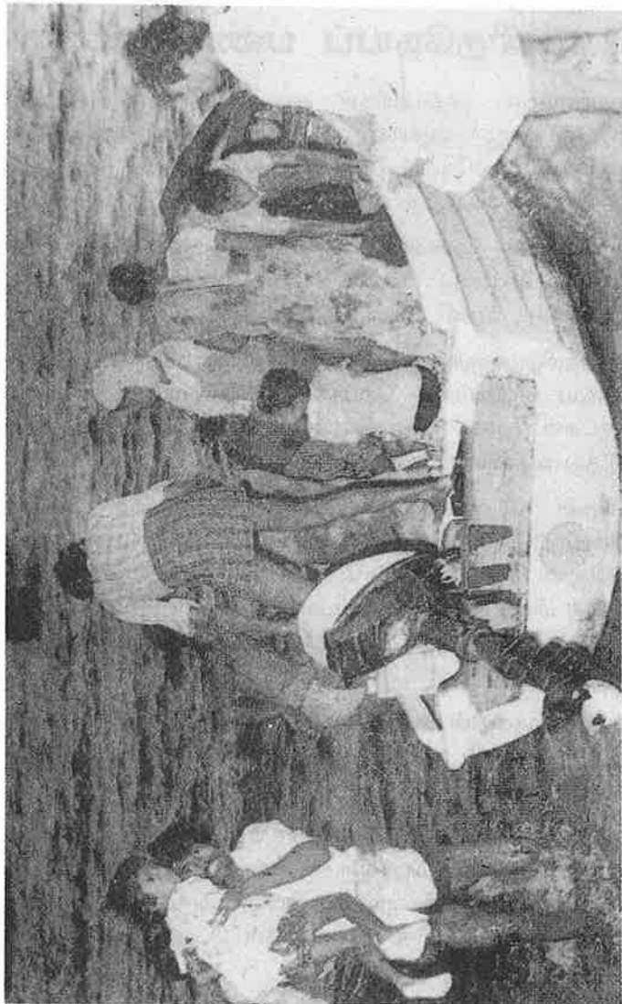
வீடுகளையும் பூர்வீக தமிழ் மன்னையும் இழந்து கண்ணீரோடு தமிழகத்திற்குவரும் ஈழத்தமிழர்கள்.