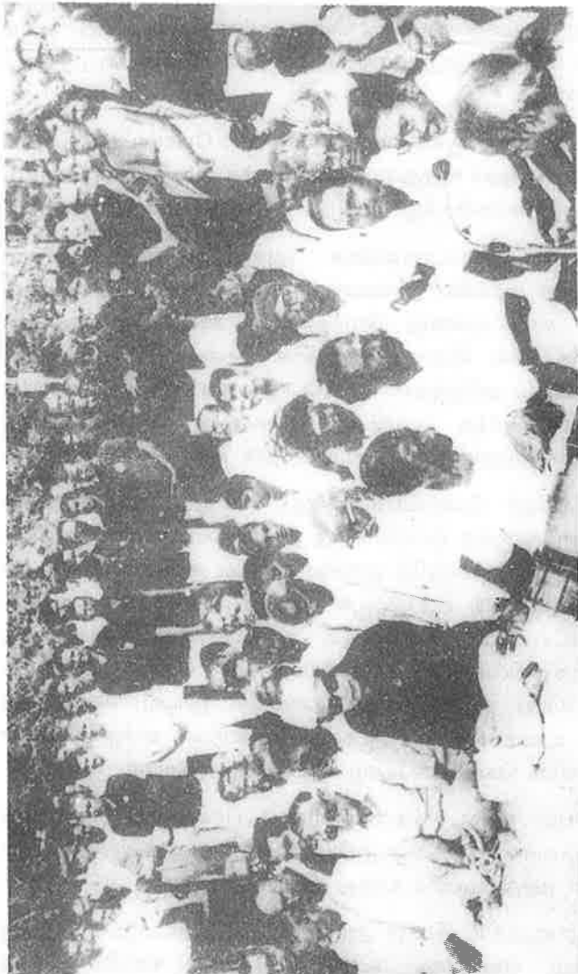
இலங்கை அரசை கண்டித்து தனது உடல்நிலை பாதிக்கப்பட்டிருந்தபோதும் 24.9.85இல் 12 மணிநேரம் உண்ணாநோன்பு இருக்கிறார் மக்கள் திலகம் மற்றும் இசைக் குழுவினர் ஈழத்தமிழர்களுக்கு ஏற்பட்டுள்ள இன்னல்களை விளக்கி பாடுகிறார்கள்.