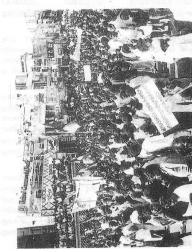
சிங்கள கொடுங்கோல் அரசுக்கு அமெரிக்க அரசு ஆயுத உதவிகள் செய்வதைக் கண்டித்து எம்.ஜி.ஆர் அவர்களால் நடத்தப்பட்ட பேரணி.

செயங்கொண்டாரின் வரிகளால் வருணிப்பதா? இப்படை தோற்கின் “எப்படை வெல்லும்” என்ற பேராசிரியர் சுந்தரம் பிள்ளையின் வீரவரிகளால் விளக்குவதா? அந்த அளவுக்கு உலகமே வியக்கும் வண்ணம் அமைந்திருந்தது. மக்கள் திலகம் எம்.ஜி.ஆர் நடத்திய அந்தப் பேரணி.