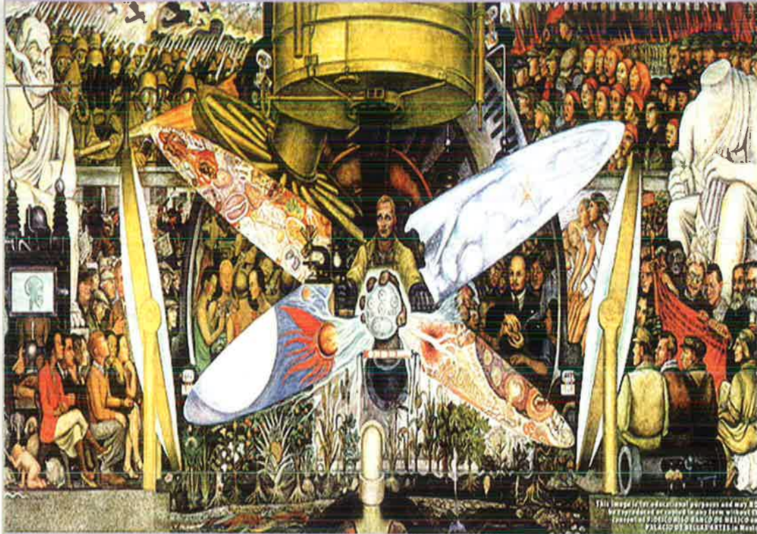
மனிதனை, பீரபஞ்சத்தின் கட்டுப்பாட்டாளன் - Diego Rivera, 1934

தொடர்புகளுக்கு : E-mail : balasooria@gmail.com Tél. : 06 19 85 55 07 http://www.wsws.org/tamil/