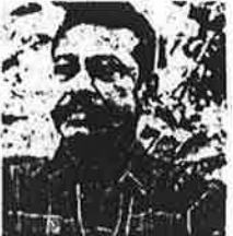
‘திமிழ்’ பத்திரிகை ‘சைவ அடித்தளம்’ சிந்தனையில் வெட்டி வரணம் செய்து, அண்மையில் தாம் முத்திரம் ஜெனரல் தராத சிந்தனை மொழி, மனவலையில் மீட்டர் மொழி, மனவலையில் மீட்டர் மொழி...