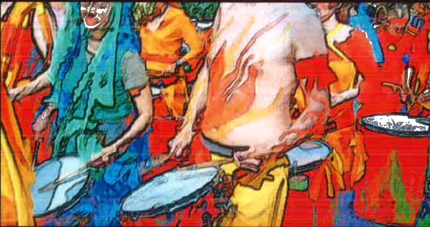
Digital art with Carnival