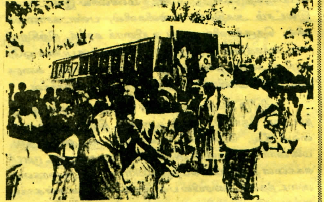
பொல்கிசின் வானில் ஏற்றப்பட்ட அகதிகள் இராமேஷ்வரத்தில்

தமது தேசத்தின் சிதைக்கப்பட்ட வரலாற்றை, பிறிதொரு மண்ணில் அனுபவிக்கும் அகதிவாழ்வின் அவலங்களை தமது சகோதர மக்களிடம் சொல்லிமாளந் துடிக்கிறார்கள். முடிவில்லா அகதிவாழ்வின் முடிவிற்கு ஒரு முடிவைத் தேட எத்தனிக்கும் அவர்கள் ஆதரவு தேடி நேசக்கரம் நீட்டுகின்றனர். ஒரு இனத்தின் பெயராலும், மதத்தின் பெயராலும் தமிழீழ மண்ணின் மேல் தொடுக்கப்பட்ட இன அழிப்பு யுத்தத்தை எதிர்த்தும், இந்திய அரசின் ஒருதலை பட்சமான தலையீட்டை கண்டித்தும் இந்திய