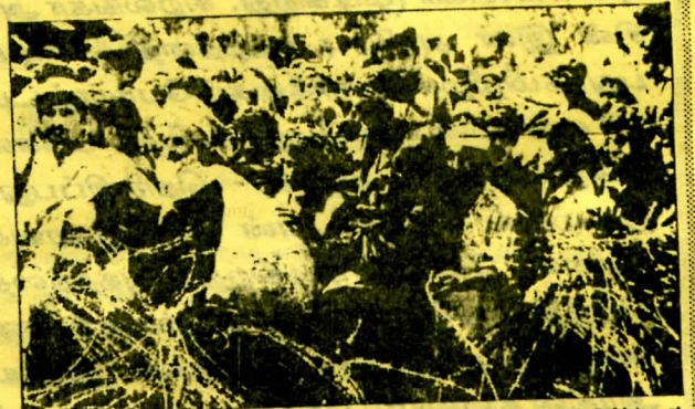
Uncertain future: Thousands of Afghan refugees wait at the border with Pakistan at Torkham after the bombing of Jalalabad by the Taliban late last month

இந்திய ராணுவம் வந்தபோது, அகதிகள் பிரச்சனை தீரும் என நம்பப்பட்டது. இந்தியாவில் இருந்த அகதிகள்கூட இலங்கைக்கு வந்தனர். ஆப்கானிஸ்தானில் நுழைந்த ரசிய ஆக்கிரமிப்பு இராணுவம் ஆப்கானிஸ்தானை விட்டு வெளியேறிய போது வெளிநாடுகளில் இருந்த ஆப்கானின் அகதிகளில் 1 இலட்சத்து 30 ஆயிரம் அகதிகள் ஆப்கானுள் சென்றனர். ஆனால் இலங்கையில் இருந்து இந்திய இராணுவம் வெளியேறிய போது இலங்கையிலிருந்து அகதிகள் வெளியேறினார்களே தவிர, வெளிநாட்டிலிருந்து இலங்கைக்குள் அகதிகள் வரவில்லை.