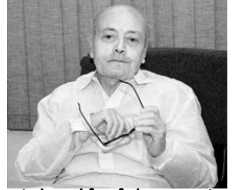
(எஸ்.பாலசுப்பிரமணியன். 1935 – 2014)

50 ஆண்டுகளுக்கும் மேலாக பத்திரிகைத்துறையில் ஆளுமை செலுத்திய ஒருவர். ஒரு கேலிச் சித்திரத்துக்காக எம்.ஜி.ஆரின் தமிழக அரசால் தண்டிக்கப்பட்டு மன்னிப்புக் கேட்க மறுத்து சிறை சென்று இறுதியில் தமிழக அரசைப் பணிய வைத்தவர்.