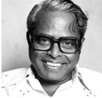
(கே.பாலச்சந்தர் 1930 – 2014)

கதைகளிலும், இராசா ராணிக் கதைகளிலும், ஜமின்தார் கதைகளிலும் மூழ்கியிருந்த தமிழ் சினிமாவை மத்தியதர மக்களின் பிரச்சினைகளைச் சொல்லும் ஊடகமாக மாற்றியதில் பாலச்சந்தர் பெருவெற்றி கண்டார்.