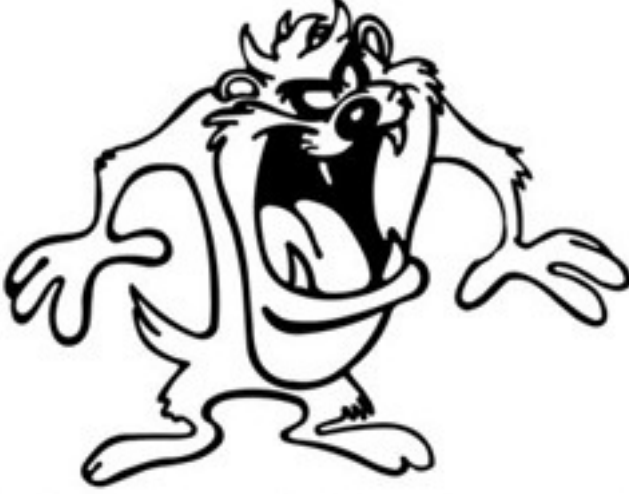
நான் எப்போது தலைவராவது?