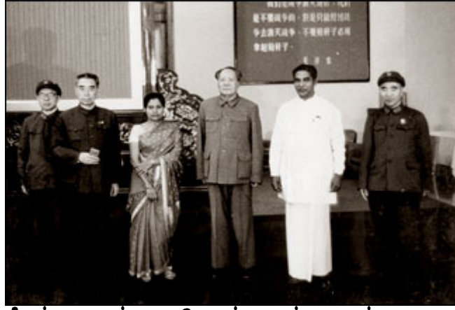
சீனத்தலைவர் மாஓசேதுங் அவர்களுடன் எஸ்.டி. பண்டாரநாயக்கவும் துணைவியாரும்

எனவே மக்களினது கோரிக்கையை வலியுறுத்தியும், அரசின் மக்கள் விரோத நடவடிக்கைகளுக்கு எதிர்ப்புத் தெரிவித்தும், இடதுசாரிக் கட்சிகள் 1953 ஓகஸ்ட் 12ஆம் திகதி மாபெரும் ஹர்த்தால் ஒன்றுக்கு அழைப்பு வீடுத்தன. அந்த அழைப்புக்கு ஆதரவாக முழுநாடுமே கிளர்ந்தெழுந்தது. அதனால் ஐ.தே.க அரசு பதவியைவிட்டு ஓடியது. இந்தப் போராட்டத்துக்கு பண்டாரநாயக்காவின் சுதந்திரக் கட்சியும் ஆதரவு தெரிவித்ததுடன், அந்தப் போராட்டத்தின் படிப்பினைகளையும் அவர் கிரகித்துக் கொண்டார்.