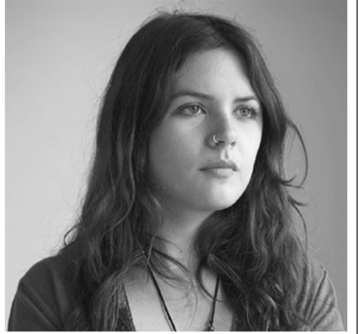
Camila Antonia Amaranta Vallejo Dowling

கமீலா ஆரம்பித்த இந்தப் போராட்டத்தால் முழு சீலி நாடுமே ஸ்தம்பித்தது. ஒவ்வொரு வாரமும் சுமார் 2 இலட்சம் மாணவர்கள் தலைநகர் சந்தியாகோவை (Santiago) முற்றுகையிட ஆரம்பித்தனர். அதன் காரணமாக பல பல்கலைக்கழகங்களும், பாடசாலைகளும் காலவரையின்றி மூடப்பட்டன. பொலிசாரும் இராணுவத்தினரும் வரவழைக்கப்பட்டு, அவர்கள் கண்ணீர்ப்புகை, குண்டாந்தடி, துப்பாக்கிக் பிரயோகம் என்பனவற்றை நிகழ்த்திய போதிலும், மாணவர்களின் போராட்டத்தை அவர்களால் கட்டுப்படுத்த முடியவில்லை. அதன் காரணமாக சீலி அரசாங்கம் ஒரு முழுக் கல்வி ஆண்டையே இரத்துச் செய்யவேண்டி ஏற்பட்டது.