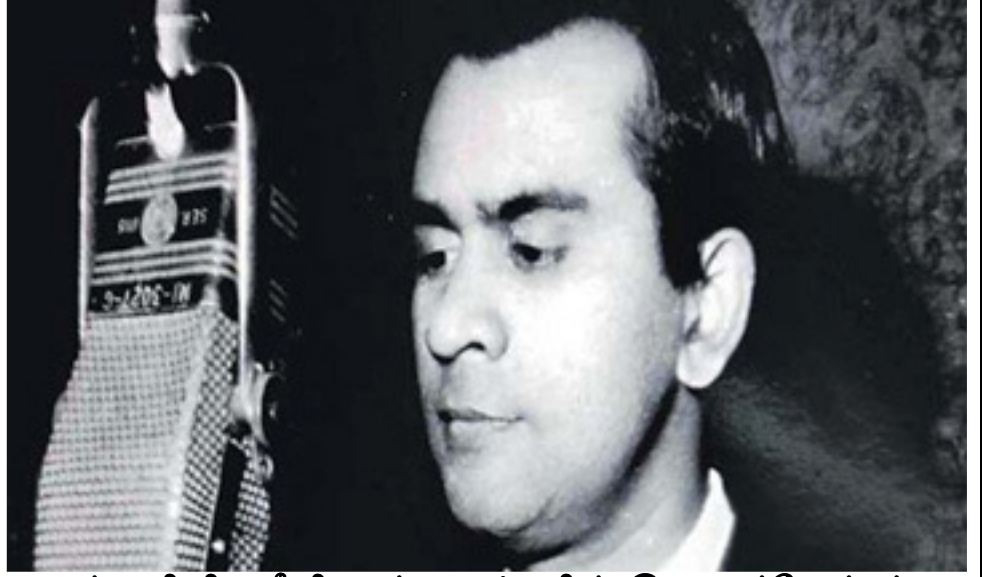
மறைந்த பி.பி. ஸ்ரீனிவாஸ் அவர்களின் இளமைத்தோற்றம்

அதொரு கோடைக்காலம். வேலிகளெல்லாம் கருகி சருகுபத்தியிருந்தது. நிறையக் கண்ணறை கண்டிருந்தது. கறையான் தன் கை (வாய்) வரிசையைக் காட்டியிருந்தது. எப்படியும் இன்று அடைப்பதாக முடிவு. வேலியடைக்கும் போது எமக்கொரு வழமையுண்டு. அது றேடியோ கேட்பது. வேலியடைக்கும் போது மட்டுமல்ல, வெங்காயம் பீடி கட்டும்போதும், பெண்கள் அடுக்களையில் சமையல் செய்யும்போதும், அரிசிபீடிக்கும் போதும், றேடியோக் கேட்டபடிதான்.