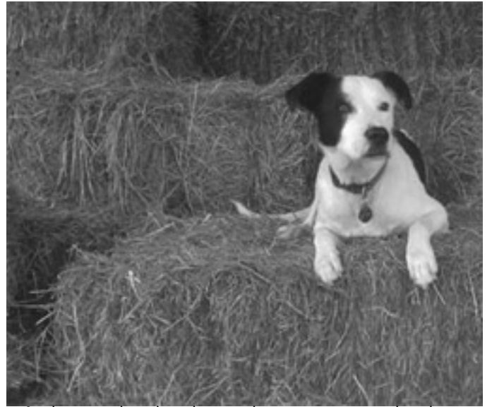
சிறீலங்கா சுதந்திரக் கட்சியிலுள்ள ஜனநாயக எண்ணம் கொண்டவர்களும் கோரி வருகின்றனர்.

மறுபக்கத்தில் இந்த 13ஆவது திருத்தச் சட்டத்தில் மாற்றங்கள் எதுவும் செய்யாமல், அதை அப்படியே அமுல்படுத்த வேண்டும் என, அரசாங்கத்தில் அங்கம் வகிக்கும் இடதுசாரிக் கட்சிகளும், தமிழ் - முஸ்லீம் மக்களைப் பிரதிநிதித்துவம் செய்யும் கட்சிகளும்,