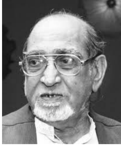
அஸ்கார் அலி இஞ்சினியர்

இந்தியாவின் புகழ்பெற்ற இஸ்லாமிய அறிஞரான அஸ்கார் அலி இஞ்சினியர் (Asghar Ali Engineer) மே 14, 2013 அன்று மும்பை நகரில் தமது 73ஆவது வயதில் காலமாகிவிட்டார். அவரது மறைவு குறிப்பாக இஸ்லாமிய