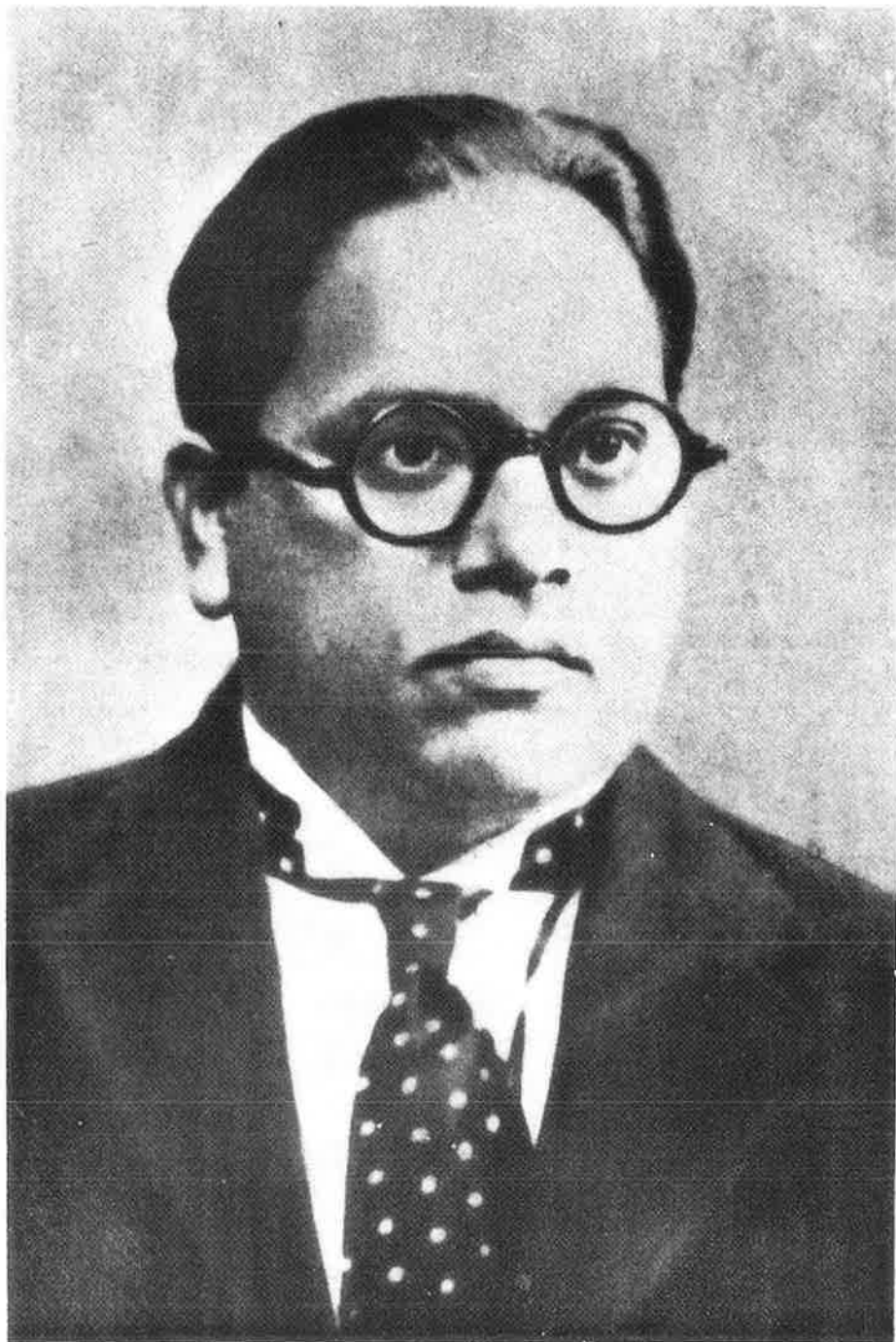
டாக்டர் பாபாசாகேப் அம்பேத்கர், எம். ஏ, பிஎச். டி., டி. எஸ்ஸி., பார்-அட்-லா., எல். எல். டி., டி. லிட்., 1891—1956